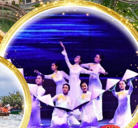
โชว์สุดอลังการ Charming at danang