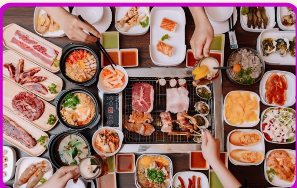
พิเศษ!! เมนูซาซิมิ+บุฟเฟ่ต์ปิ้งย่าง