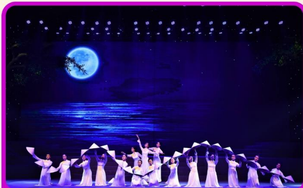
ชมการแสดง Charming Show Danang